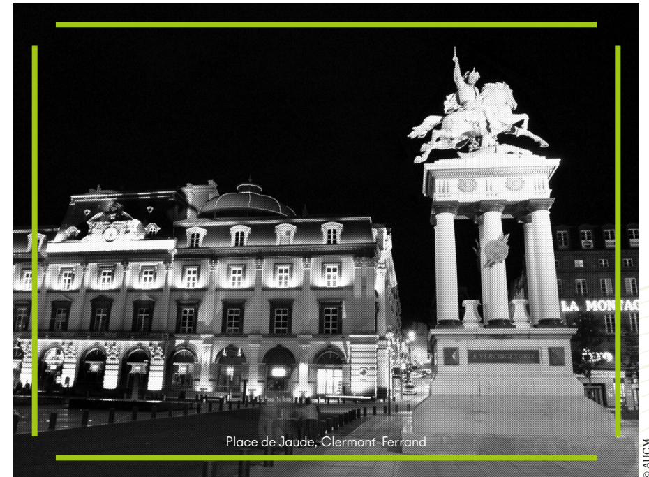
Place de Jaude, Clermont-Ferrand

Cependant, au regard du thème de cette exploration, on trouve ici une spécificité : la métropole clermontoise ne dispose pas d'un quartier culturel ou créatif. Néanmoins, les lieux culturels et créatifs y sont, eux, foisonnants. Cette balade autour de la butte clermontoise nous conduira ainsi de lieu en lieu, d'acteur en acteur, à la découverte d'une diversité d'expériences.