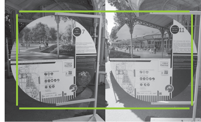
Parc des Sources Classé au titre des Monuments Historiques, le Parc des Sources entame sa rénovation.