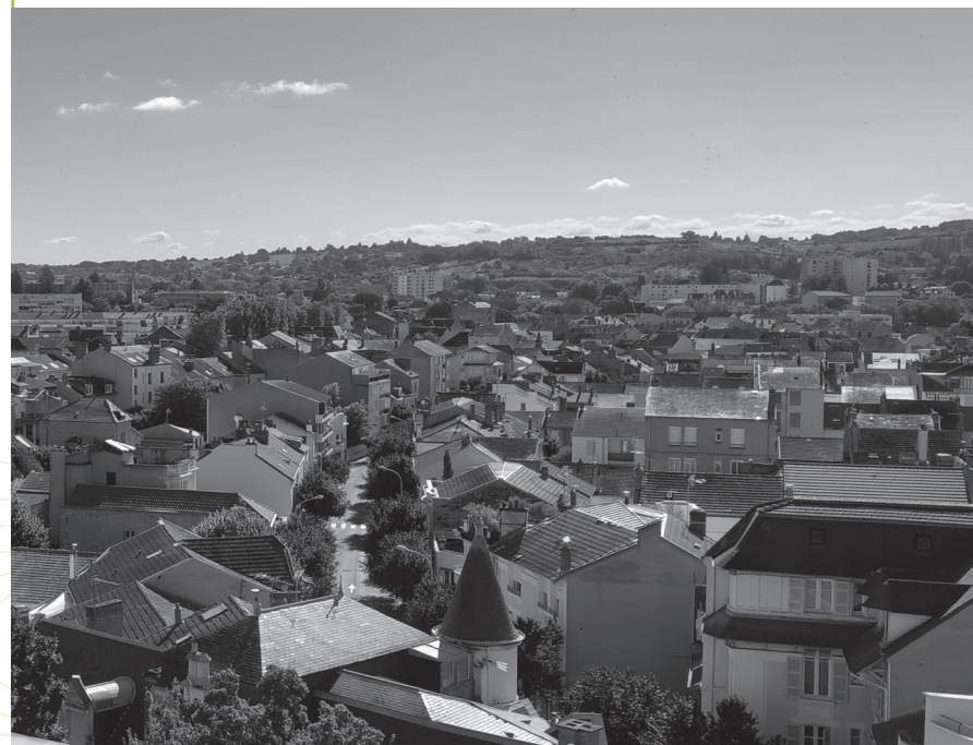
Vue de Vichy depuis le pôle Lardy.

Les impératifs environnementaux auxquels sont soumis les territoires appellent à multiplier les initiatives et projets susceptibles de modérer la trajectoire climatique. En une génération, il s'agit de rénover l'ensemble du parc de logements, réhabiliter les équipements, planter des milliers d'arbres, renaturer des dizaines d'hectares, ou encore produire de l'énergie décarbonée... En quoi la symbolique urbaine d'une ville thermale classée au patrimoine mondial de l'Unesco telle que Vichy revêt un cadre d'opportunité unique pour fédérer les initiatives et faire culture commune ? Plus largement, comment nos patrimoines s'illustrent comme témoins d'un récit collectif des transitions ?