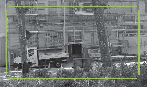
1A Ancien hôtel Massena & 1B Ancien hôtel Concorde Réhabilitation d'anciens hôtels en logements