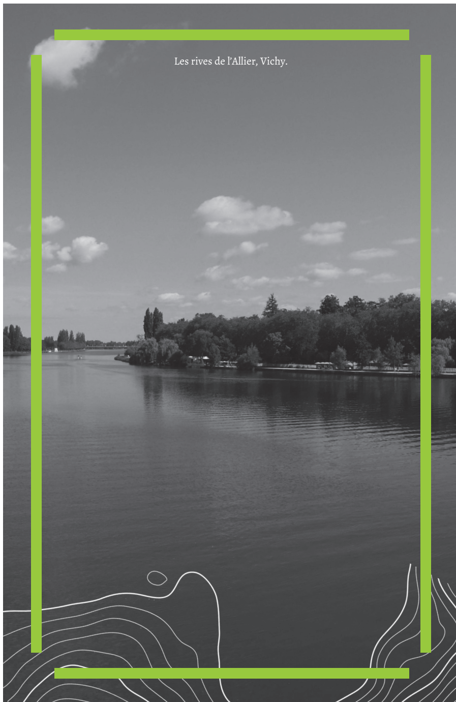
Les rives de l'Allier, Vichy.