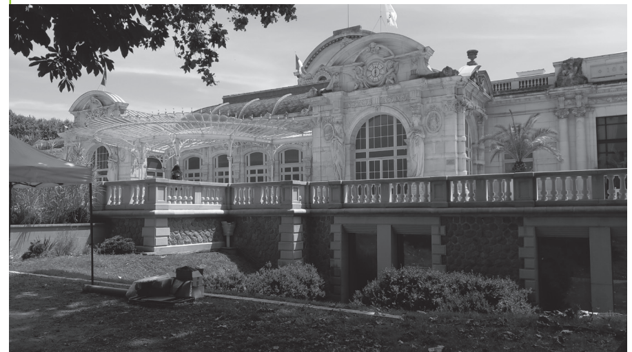
Opéra de Vichy.